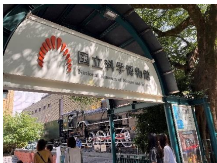
国立科学博物館入口