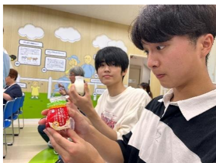
雪印メグミルク試食