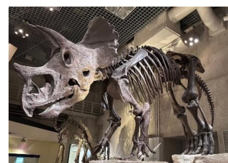
博物館内の恐竜の模型