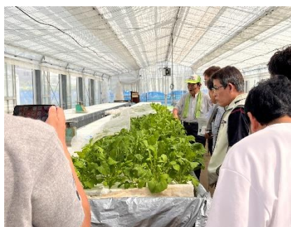
水耕栽培研究施設