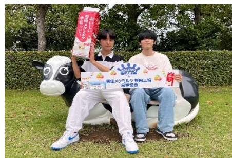
雪印メグミルクで記念撮影