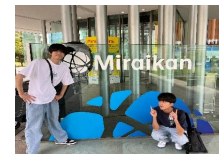
日本未来科学館入口