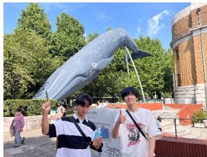
博物館外のシロナガスクジラ