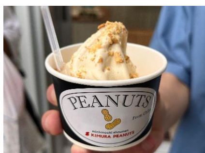
落花生を使ったソフトクリーム