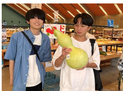
道の駅しょうなんのひょうたん